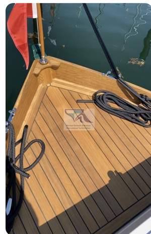
Tuck 22 5