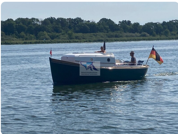
Tuck 22 15