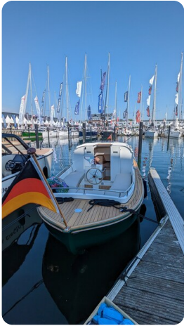
Tuck 22 27