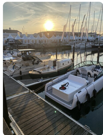
Tuck 22 16