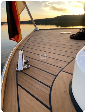
Tuck 22 6