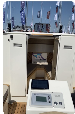
Tuck 22 8