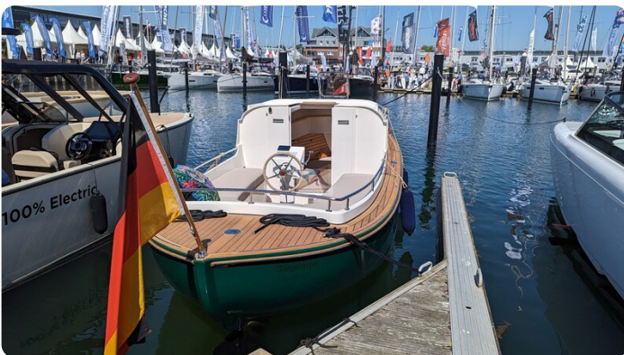
Tuck 22 28