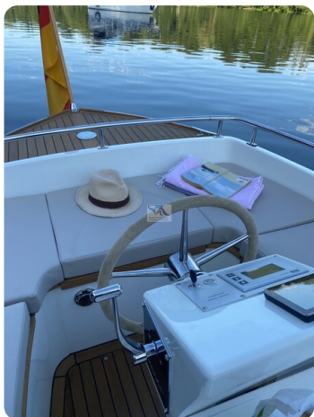
Tuck 22 7