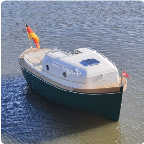
Tuck 22 4