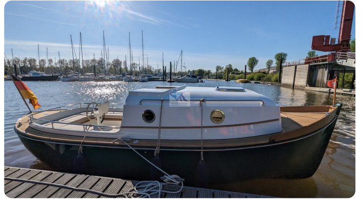
Tuck 22 3