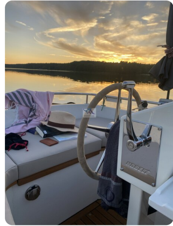
Tuck 22 22