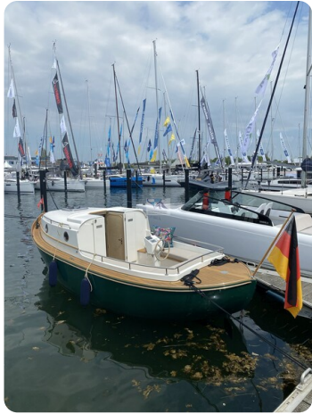
Tuck 22 17