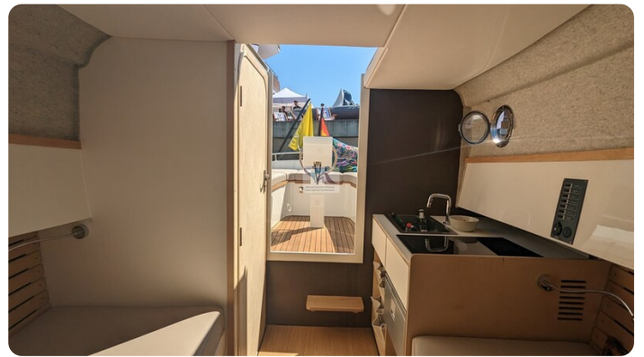
Tuck 22 13