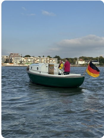
Tuck 22 26