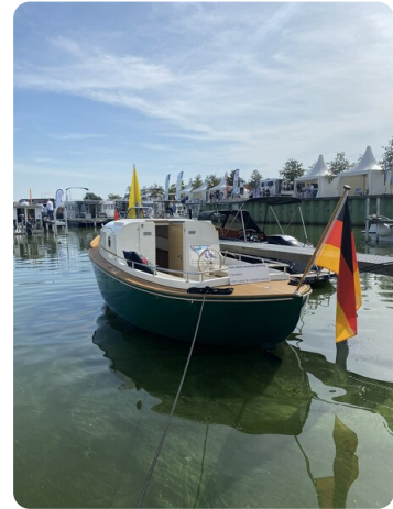
Tuck 22 21