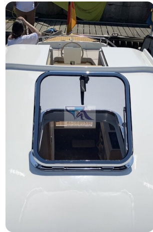
Tuck 22 20