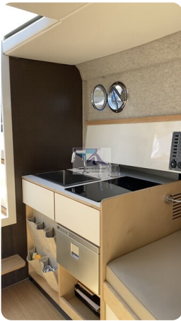
Tuck 22 11