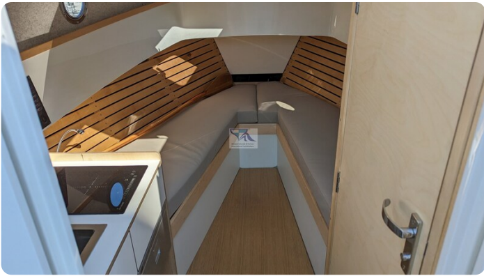
Tuck 22 9