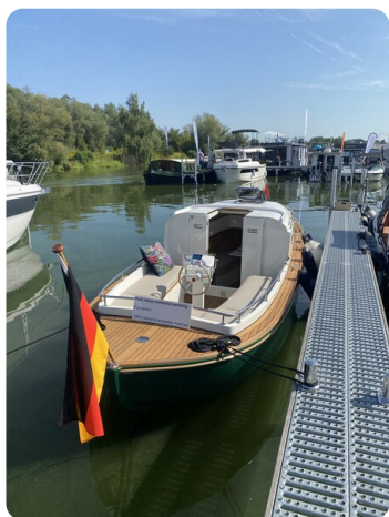
Tuck 22 1