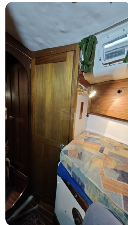
Westerly 36 Conway ANTIMALOCHE 28