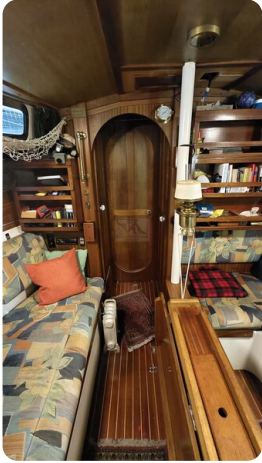
Westerly 36 Conway ANTIMALOCHE 20