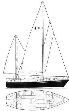
W36 Conway Layout