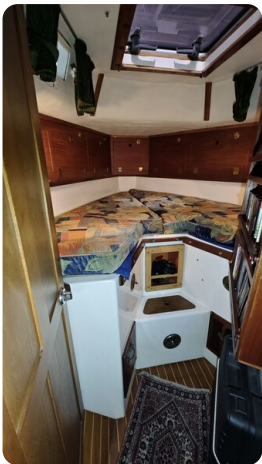
Westerly 36 Conway ANTIMALOCHE 24