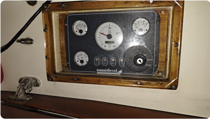
Westerly 36 Conway ANTIALOCHE 67