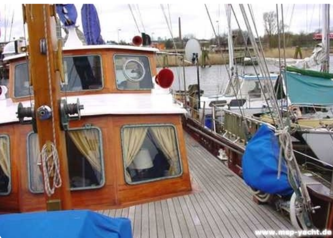
Lühsen Kutteryacht 21,50m msp256650 2