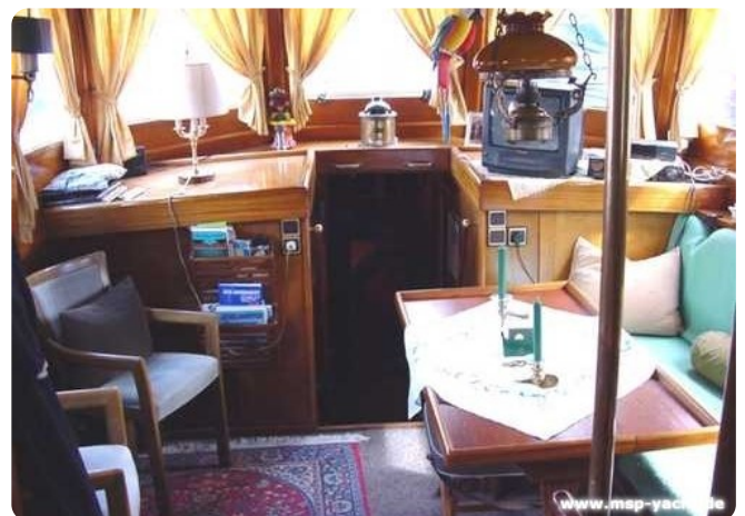
Lühsen Kutteryacht 21,50m msp256650 3