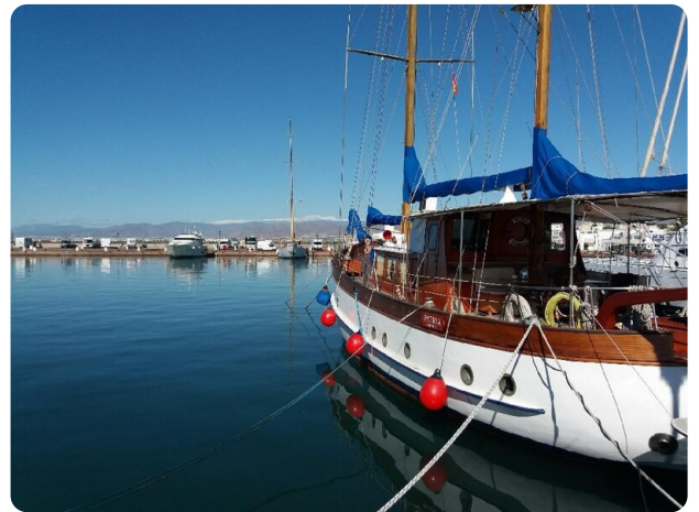
Sera Nevada Hintergrund