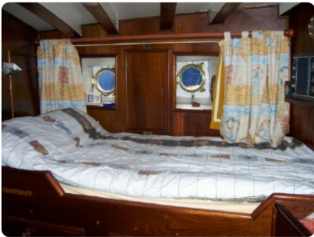
Lührsen Kutteryacht 21,50m msp256650 15