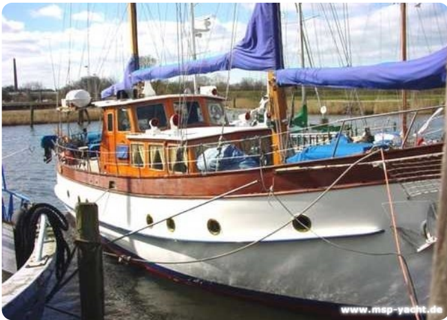
Lühsen Kutteryacht 21,50m msp256650 1