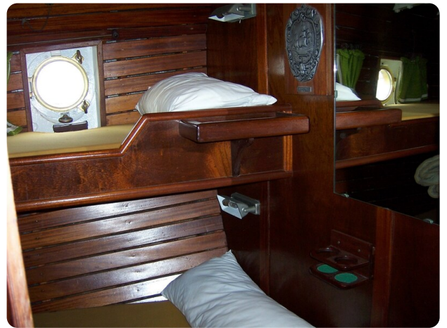
Lührsen Kutteryacht 21,50m msp256650 16