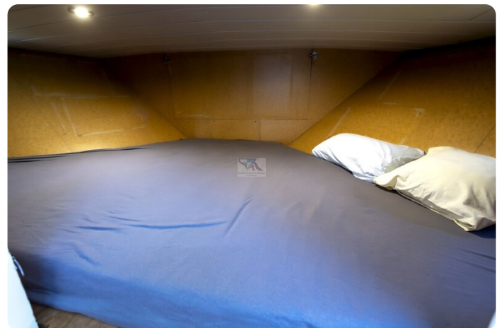
15m Stahlmotoryacht BERDA 12