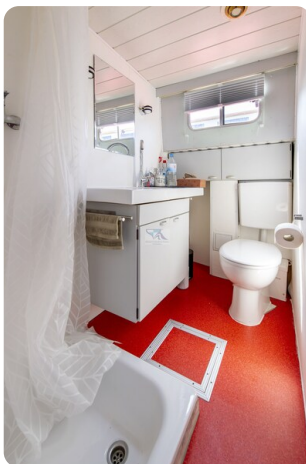
15m Stahlmotoryacht BERDA 11