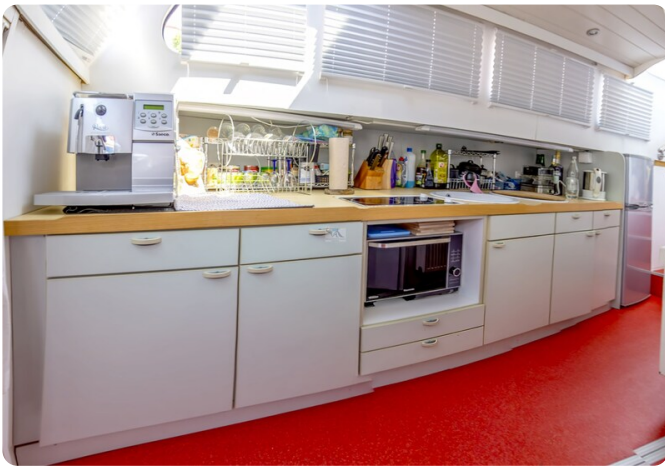
15m Stahlmotoryacht BERDA 38