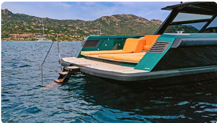
Hydraulic bathing ladder