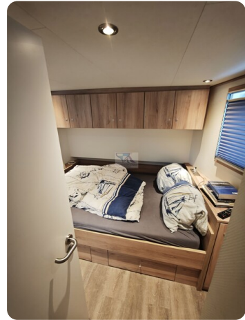
MY GINO 36