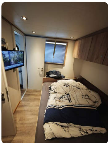
MY GINO 37