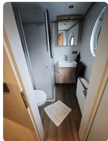
MY GINO 38