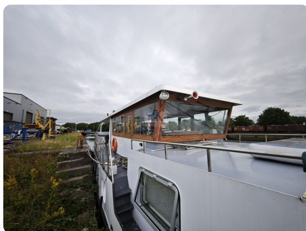
MY GINO 18