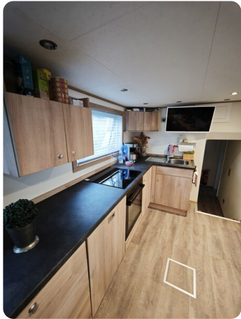
MY GINO 28