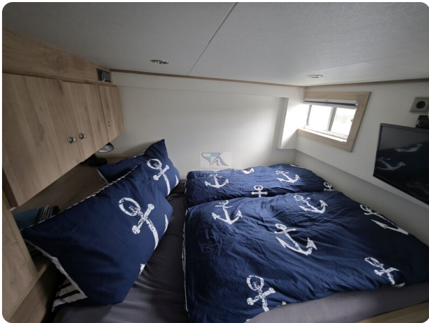
MY GINO 33