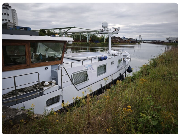
MY GINO 2