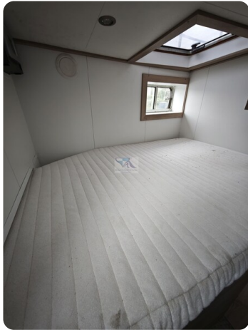
MY GINO 1