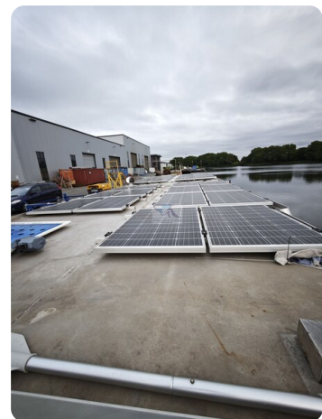
MY GINO 11