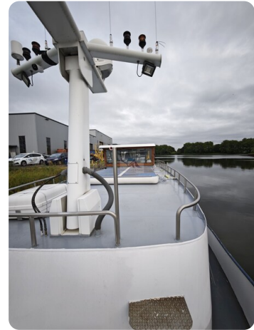
MY GINO 14