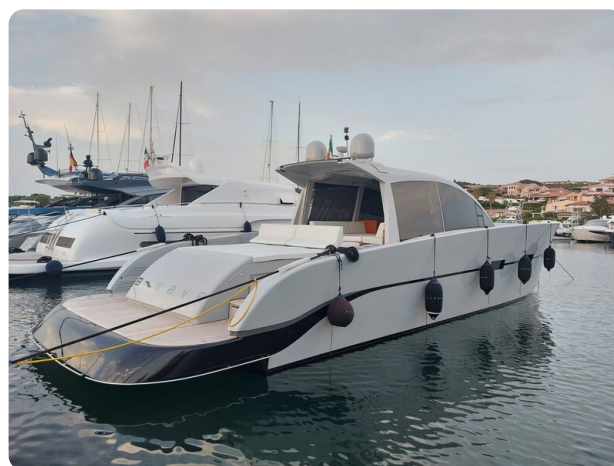
Vismara Bwave profile3