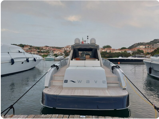
Vismara Bwave aft profile