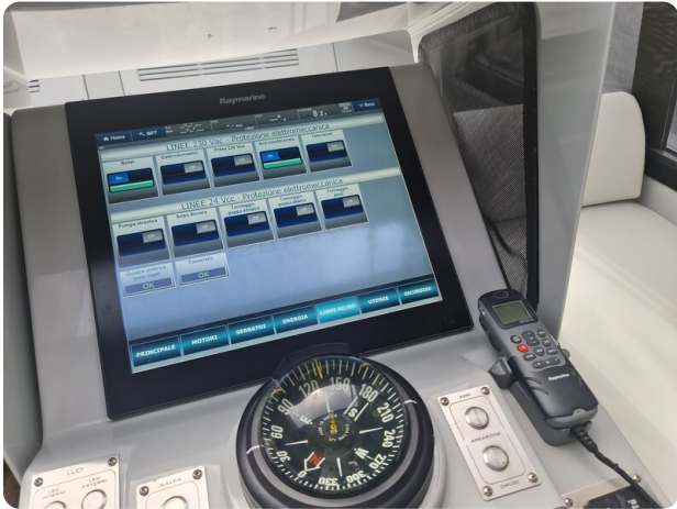
Vismara Bwave (1)