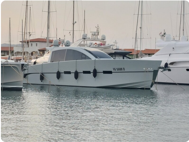
Vismara Bwave profile