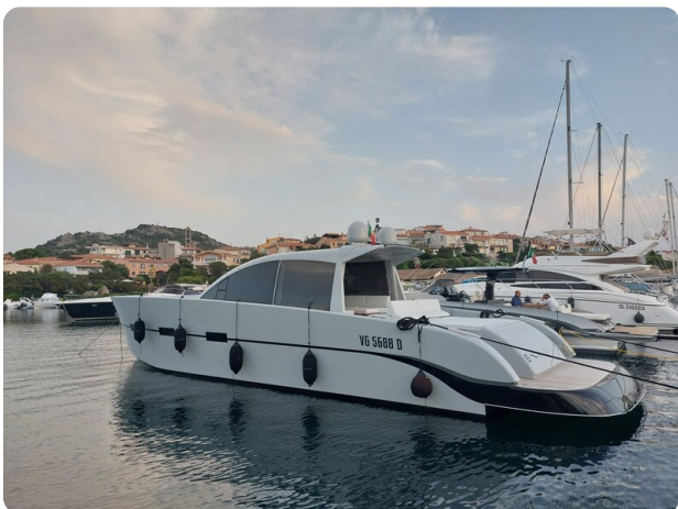
Vismara Bwave profile1