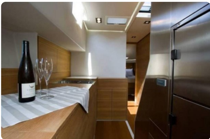
Vismara B Wave galley