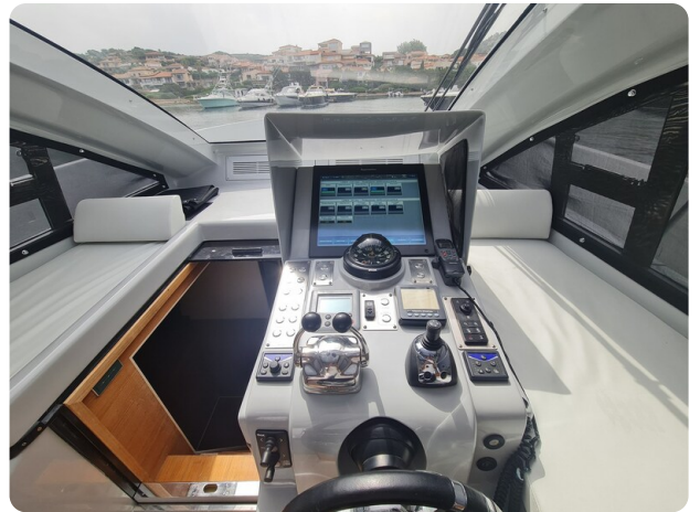
Vismara Bwave helm