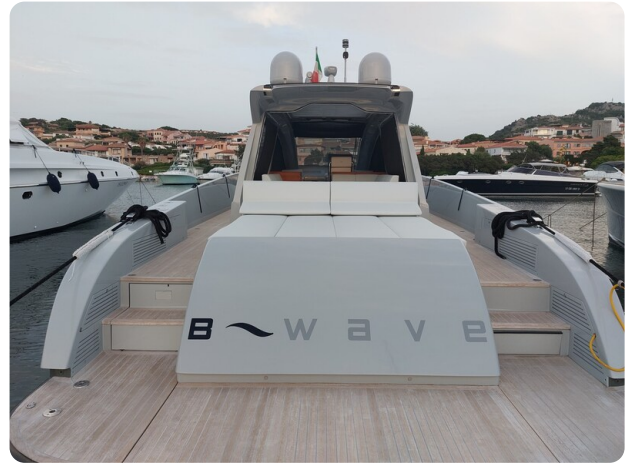
Vismara Bwave profile (1)