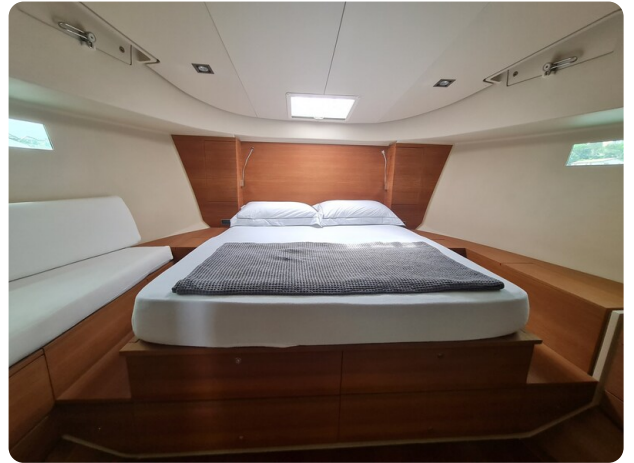
Vismara Bwave master cabine