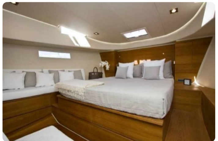
Vismara B Wave master cabin