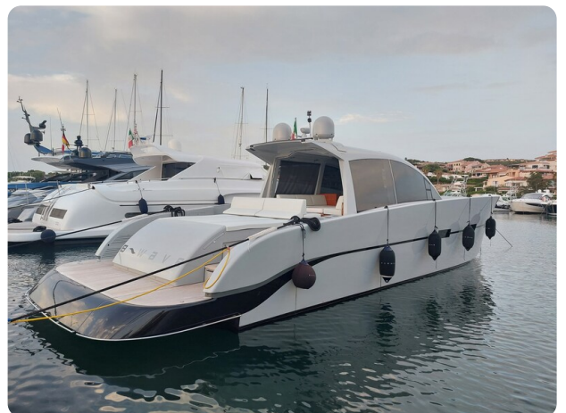
Vismara Bwave profile3