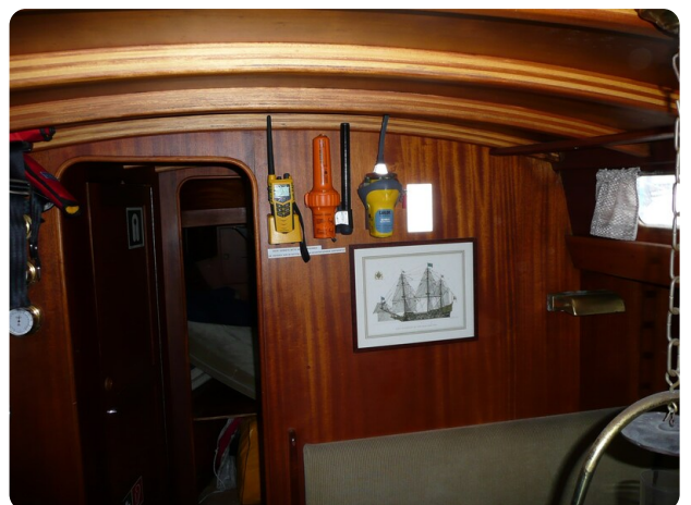
Vindö 50 msp269542 11