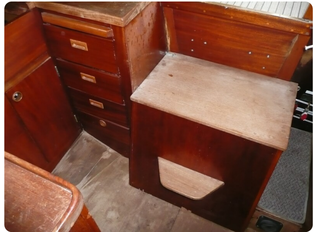
Vindö 50 msp269542 7