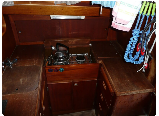
Vindö 50 msp269542 9