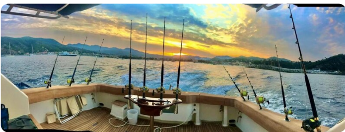
Viking 54 fishing