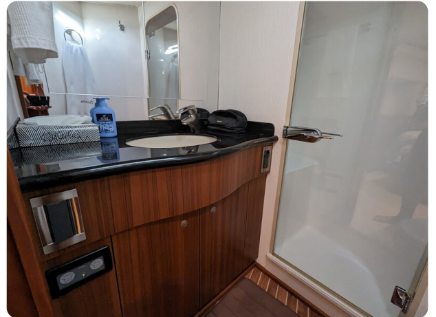
Viking 54 Convertible bathroom