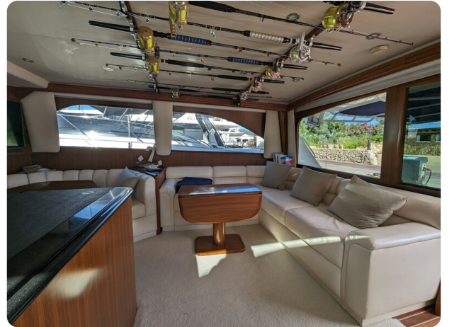
Viking 54 Convertible salon detail