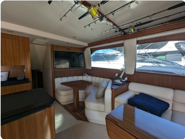
Viking 54 Convertible salon dinette