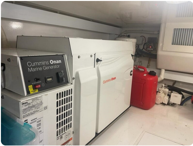
Viking 54 Convertible generator