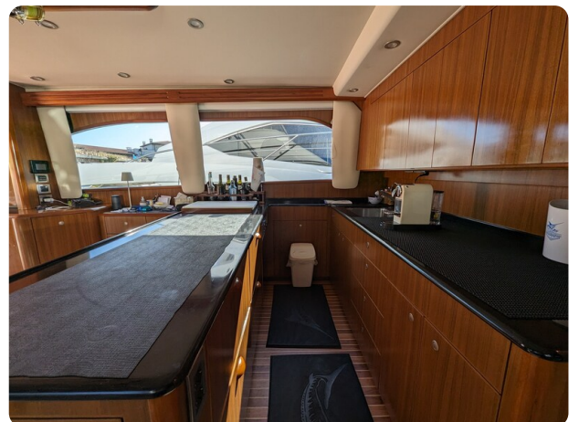
Viking 54 Convertible galley