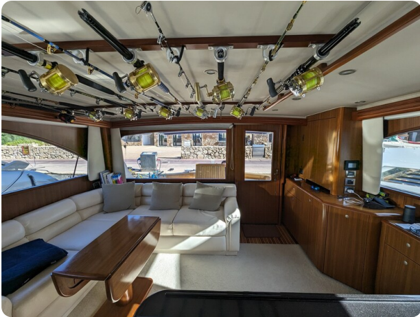
Viking 54 Convertible salon to aft