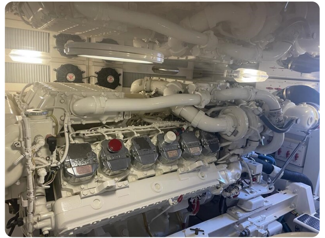
Viking 54 Convertible engine detail