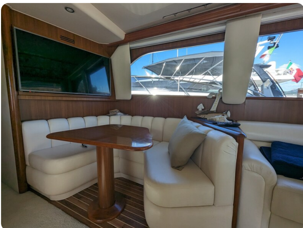
Viking 54 Convertible dinette detail