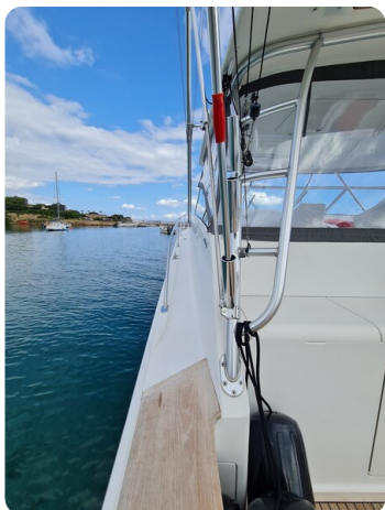
Viking 45 Open, detail