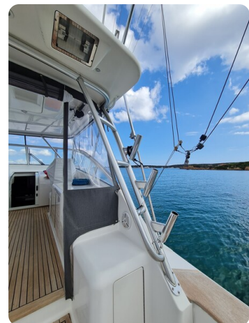
Viking 45 Open, cockpit details