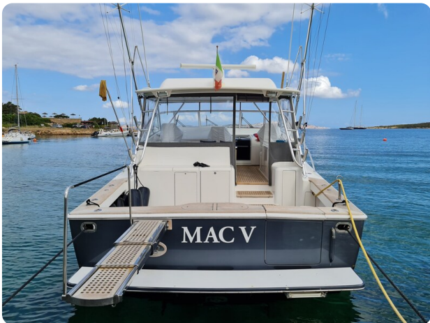
Viking 45 Open, stern view