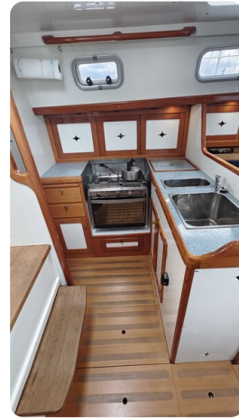
Helena 35 21