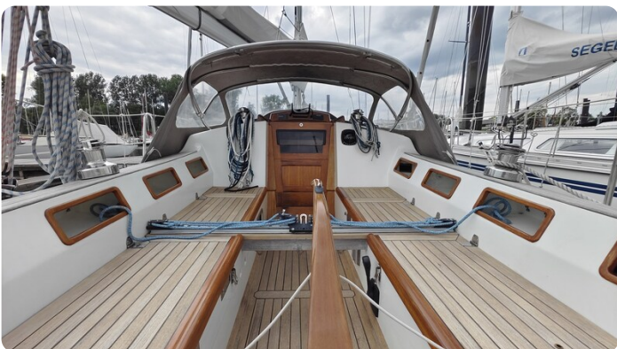
Helena 35 38