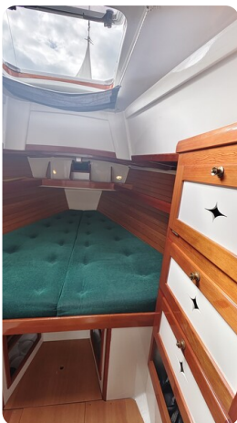
Helena 35 4