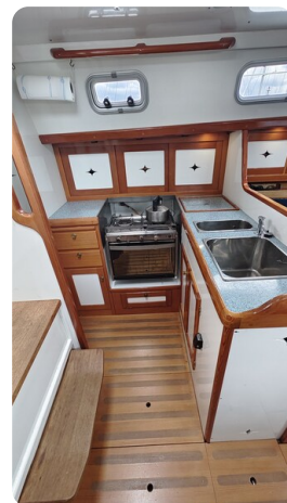
Helena 35 21