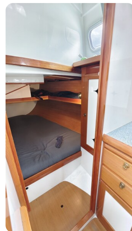
Helena 35 23