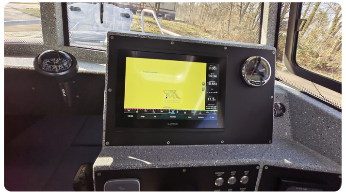
Voyager 700 Cabin_45