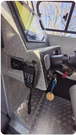
Voyager 700 Cabin_43