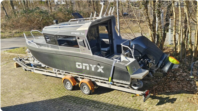
Voyager 700 Cabin_24