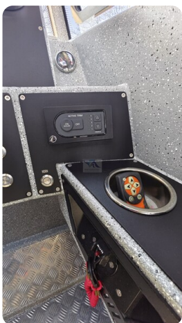
Voyager 700 Cabin_47