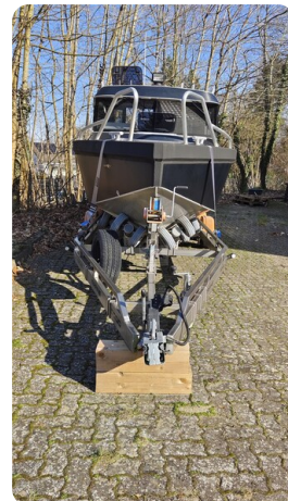
Voyager 700 Cabin_21