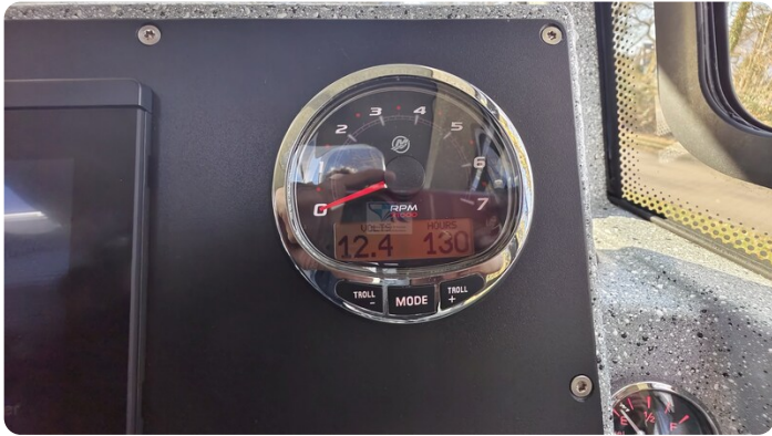
Voyager 700 Cabin_40