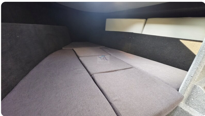
Voyager 700 Cabin_51