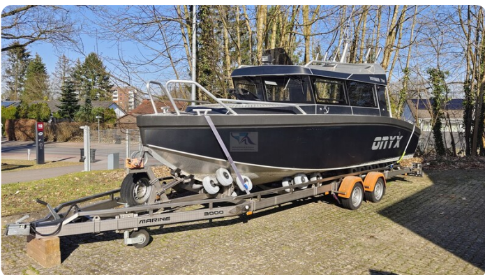
Voyager 700 Cabin_20