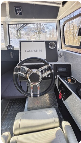
Voyager 700 Cabin_39