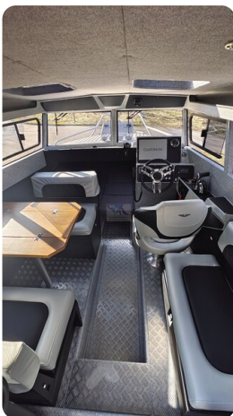
Voyager 700 Cabin_36