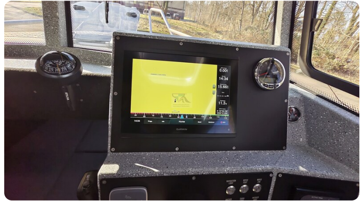
Voyager 700 Cabin_45