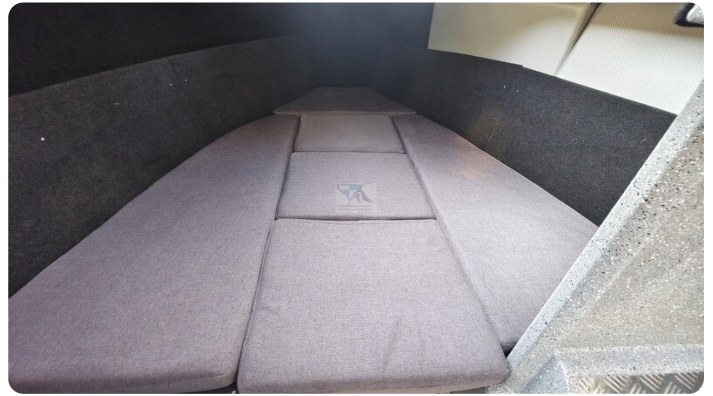
Voyager 700 Cabin_49