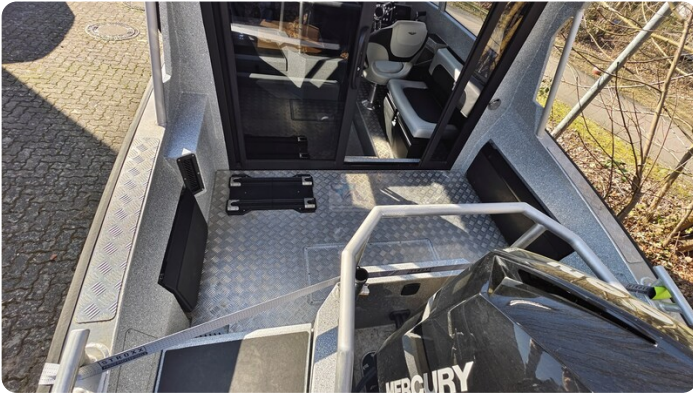
Voyager 700 Cabin_29