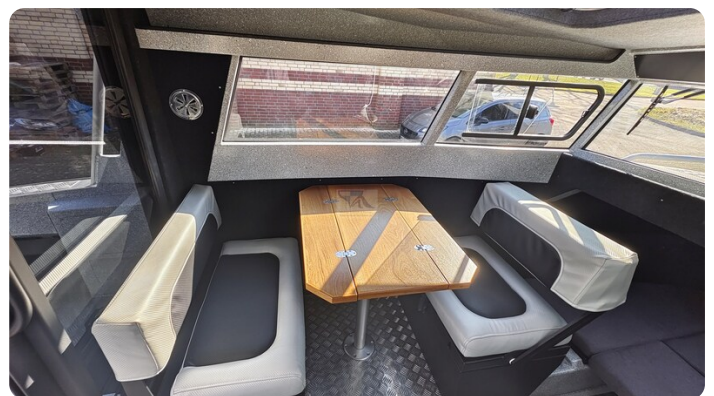
Voyager 700 Cabin_37