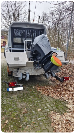
Voyager 700 Cabin_12a