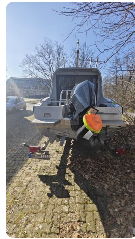
Voyager 700 Cabin_25