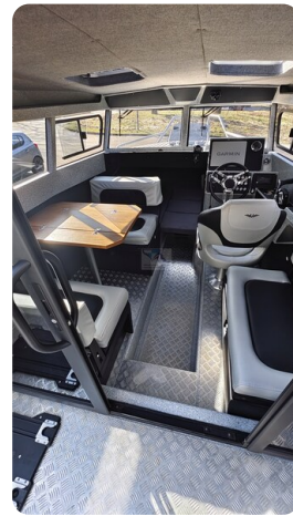
Voyager 700 Cabin_33