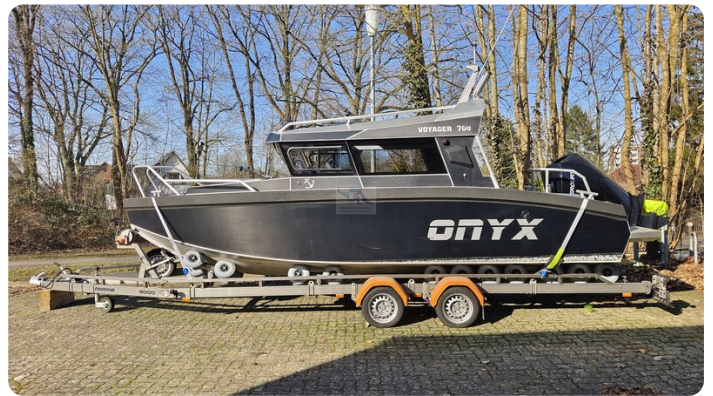
Voyager 700 Cabin_18