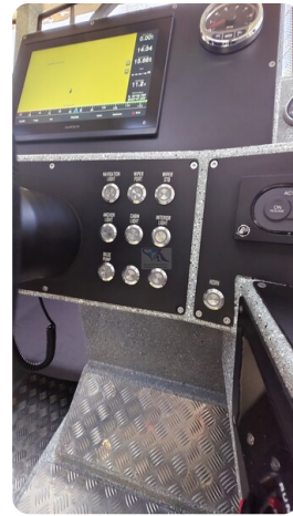
Voyager 700 Cabin_46