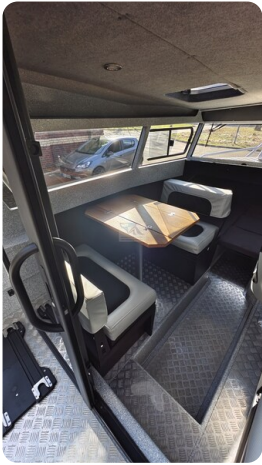
Voyager 700 Cabin_35