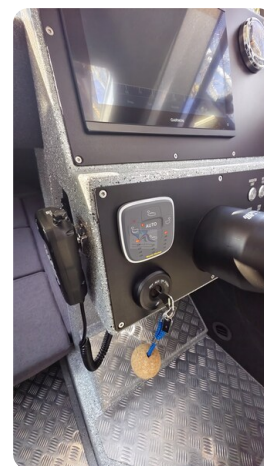
Voyager 700 Cabin_42