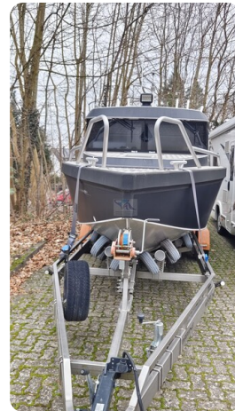
Voyager 700 Cabin_4