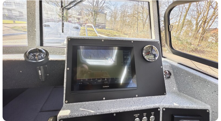
Voyager 700 Cabin_41