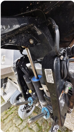
Voyager 700 Cabin_14