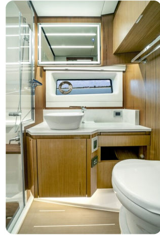
Tiara EX60 bathroom