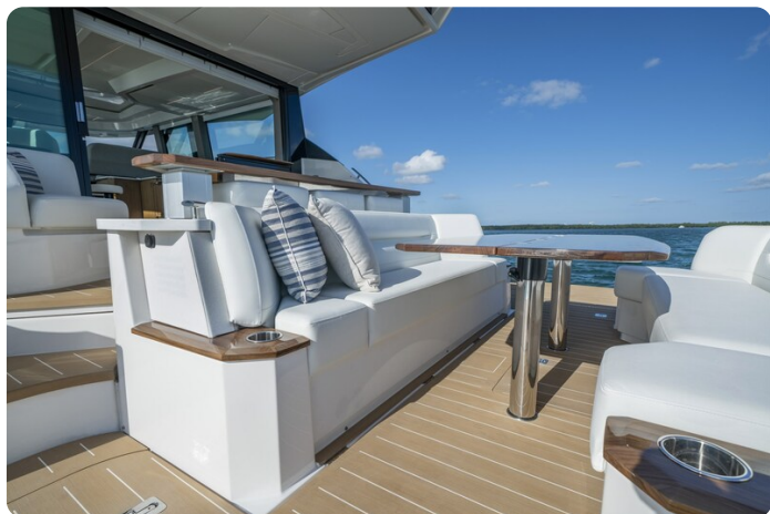
Tiara EX60 cockpit dinette