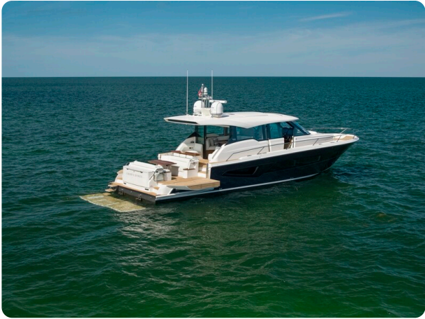
Tiara EX60 aft profile