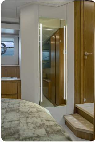
Tiara EX60 details