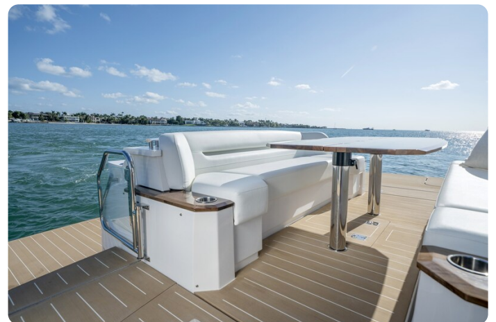
Tiara EX60 aft lounge