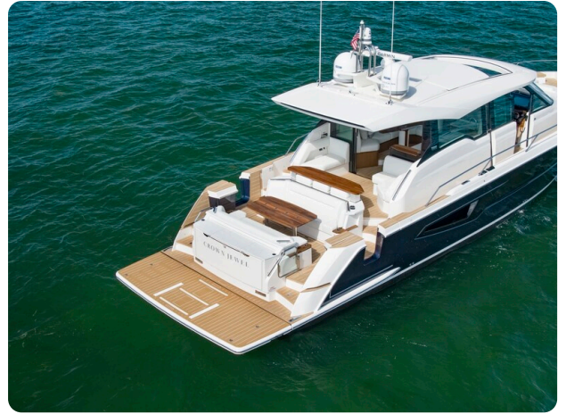
Tiara EX60 aft view