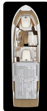
Tiara EX 60 lower layout