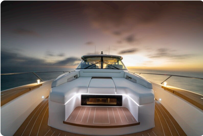
Tiara EX60 bow detail