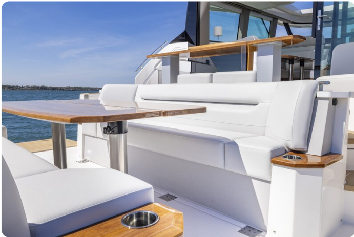
Tiara EX54 Aft Cockpit Lounge