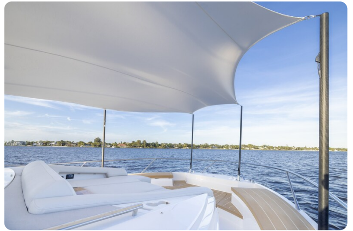
Tiara EX54 bow sunshade