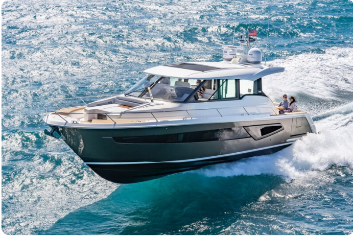
Tiara EX54 running