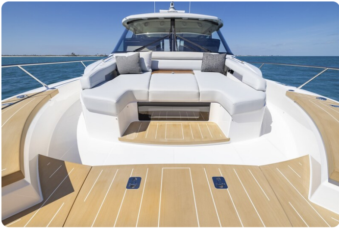
Tiara EX54 bow deck