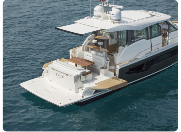
Tiara EX54 cockpit view