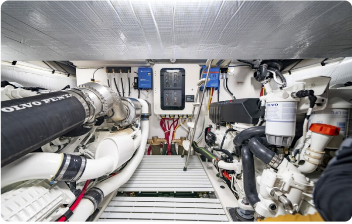
Tiara EX54 engine room