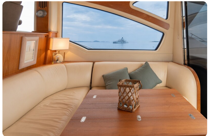
{1} Dinette detail