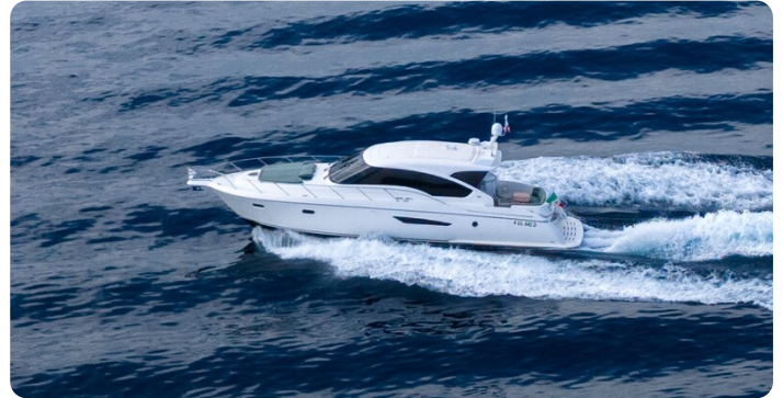
Tiara 5800 Sovran running