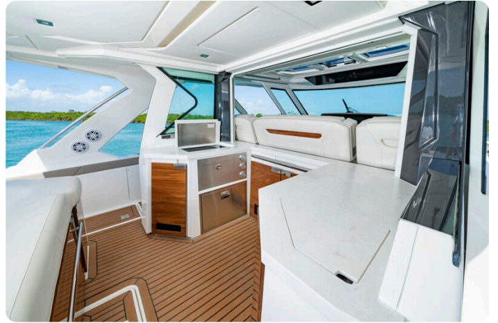
Tiara 48LS cockpit galley