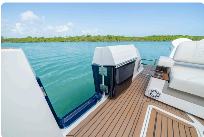
Tiara 48LS side door