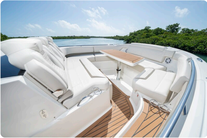
Tiara 48LS fwd dinette detail