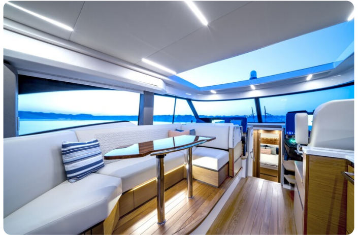
Tiara 48LE salon