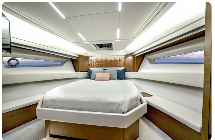
Tiara 48LE master cabin