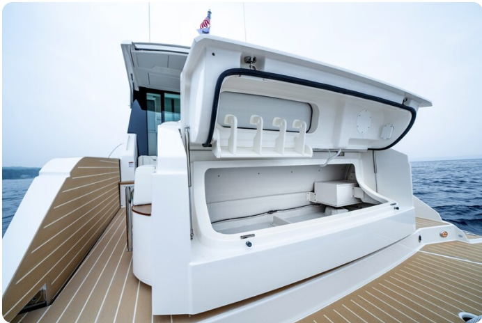
Tiara 48LE transom detail