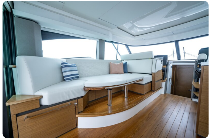
Tiara 48LE dinette