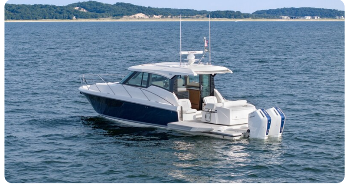
43 LE Nav