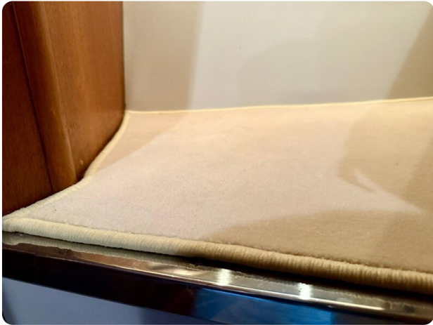
Tiara 3800 Open New Moquette