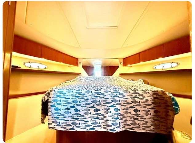
Tiara 3800 Open Cabin