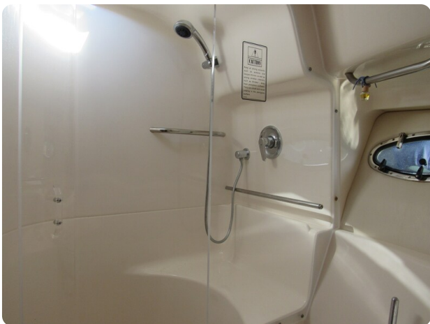
Tiara 3800 Open shower stall