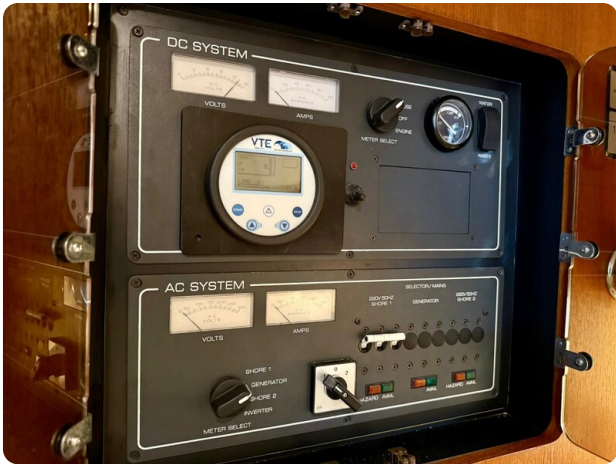
Tiara 3800 Open New Electrical Panel