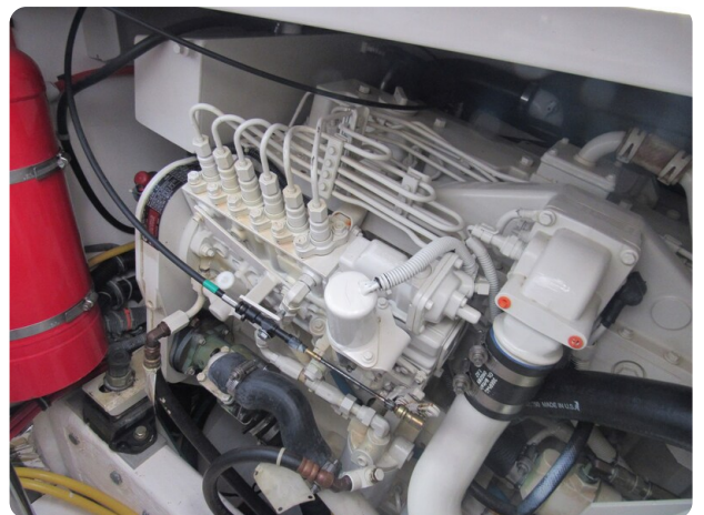
Tiara 3800 Open engine room