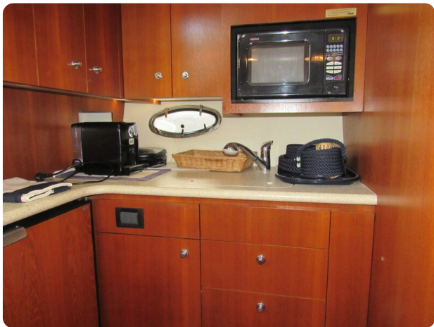
Tiara 3800 Open galley