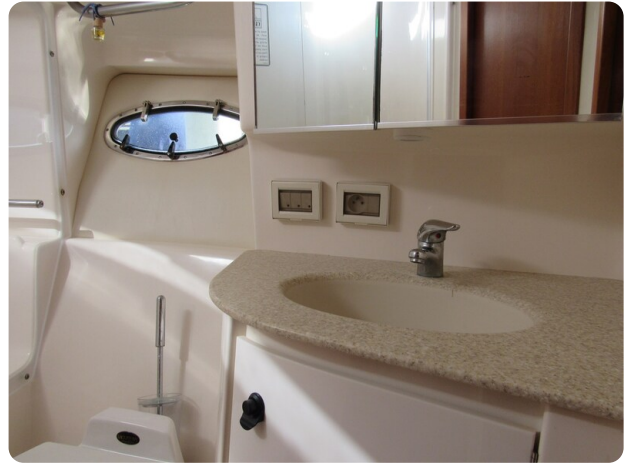
Tiara 3800 Open bathroom