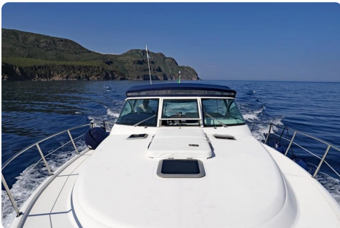
Tiara 3800 Open Bow