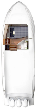
Tiara 38 LS lower layout