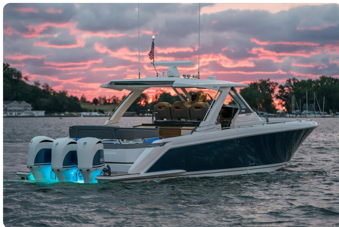
Tiara 38 LS aft profile