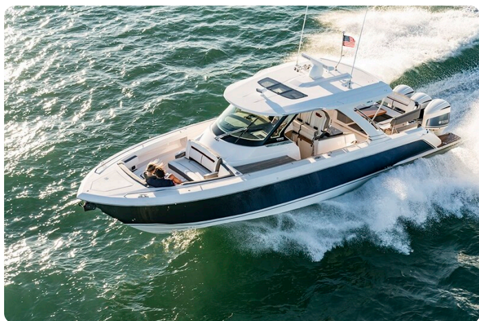
Tiara 38 LS bow profile aerial