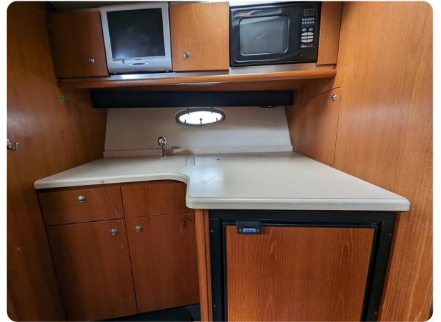
Tiara 3600 Open galley