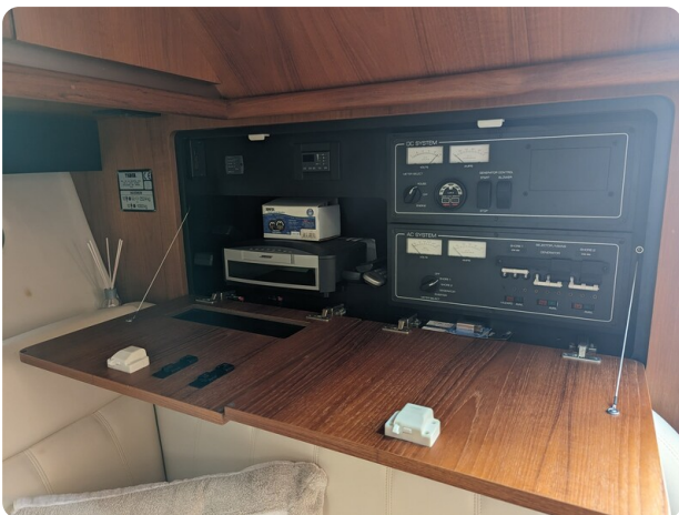
Tiara 3600 Open electrical panel