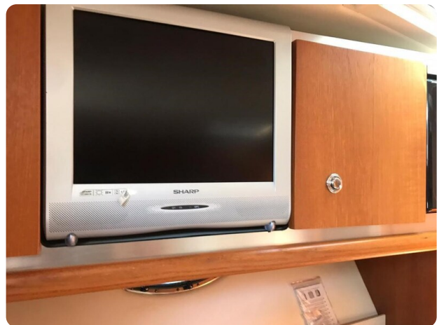
Tiara 3600 Open Tv