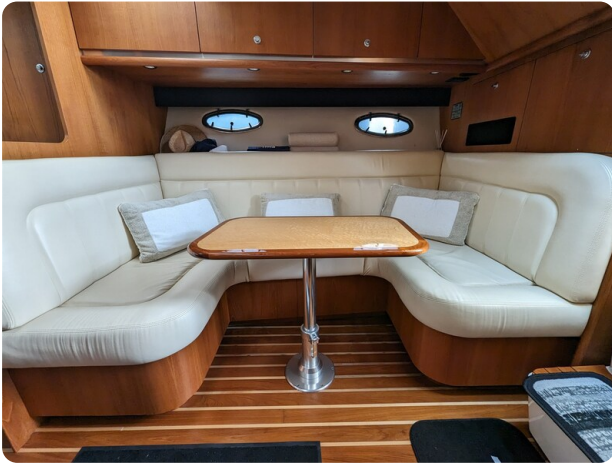
Tiara 3600 Open dinette