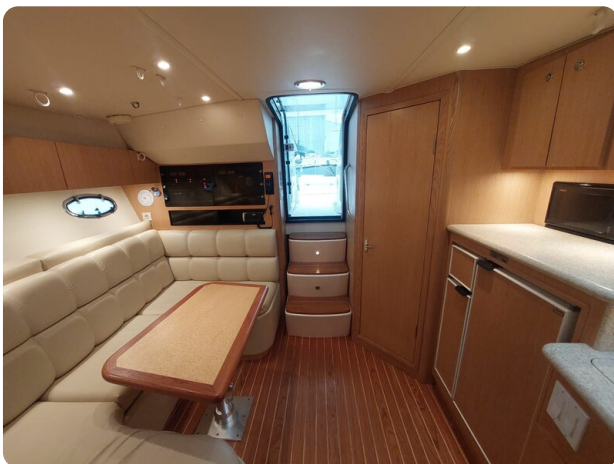
Tiara 3500 Open Sampei cabin view