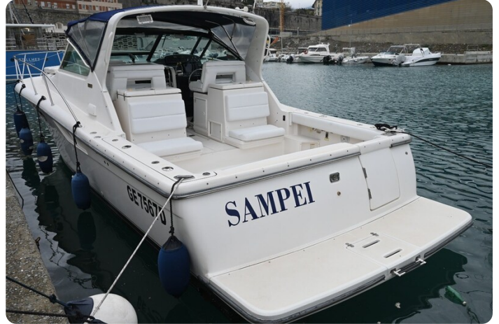
Tiara 3500 Open Sampei aft profile 2