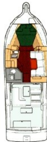
Tiara 3500 layout