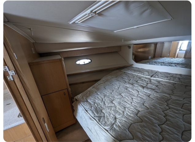
Tiara 3500 Open master cabin