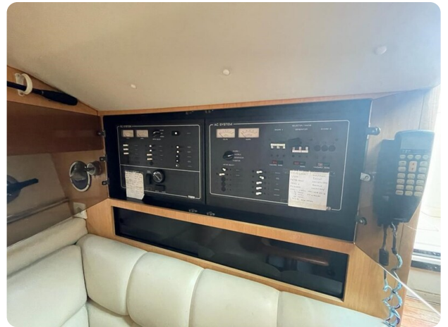
Tiara 3500 Open electrical panel.jpg