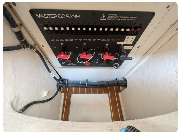
Tiara 3500 Open details view