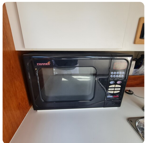
Tiara 2900 Coronet microwave combi