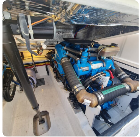
Tiara 2900 Coronet stbd engine