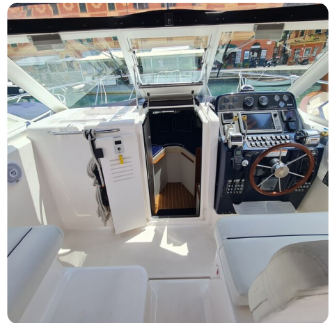
Tiara 2900 Coronet cabin door