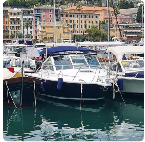
Tiara 2900 Coronet bow view