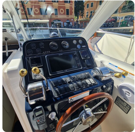
Tiara 2900 Coronet helm