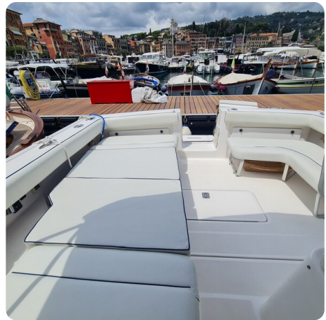
Tiara 2900 Coronet cockpit sunpad