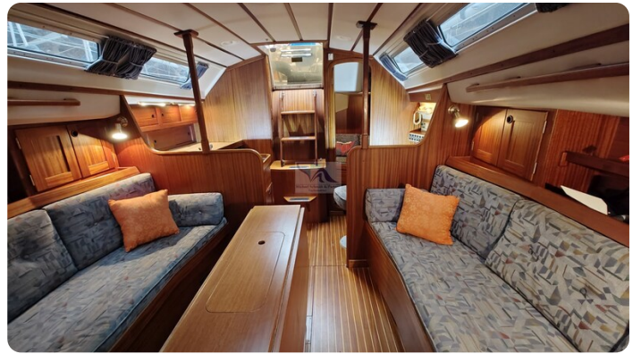
Sweden 340 SPITZMAUS 55