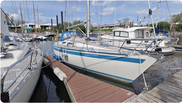
Sweden 340 SPITZMAUS IW 6