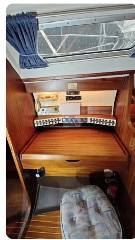
Sweden 340 SPITZMAUS 5