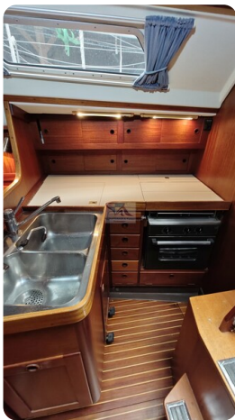
Sweden 340 SPITZMAUS 9