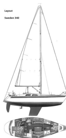
Layout Sweden 340