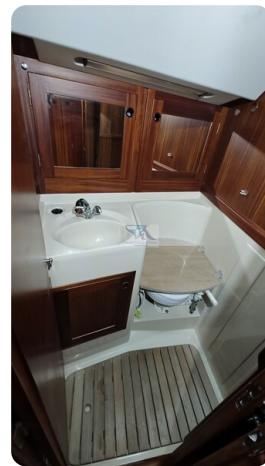
Sweden 340 SPITZMAUS 41