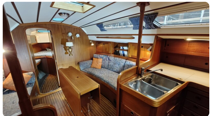
Sweden 340 SPITZMAUS 36