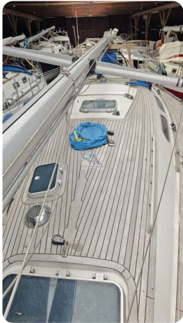
Sweden 340 SPITZMAUS 1