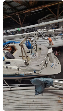
Sweden 340 SPITZMAUS 13