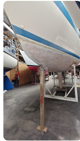
Sweden 340 SPITZMAUS 15