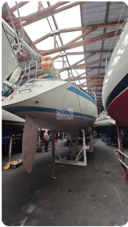
Sweden 340 SPITZMAUS 17