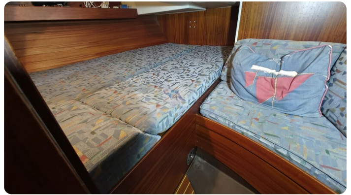
Sweden 340 SPITZMAUS 60