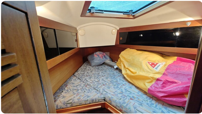
Sweden 340 SPITZMAUS 40