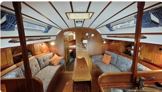
Sweden 340 SPITZMAUS 2