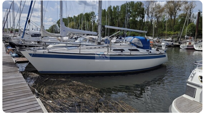
Sweden 340 SPITZMAUS IW 2