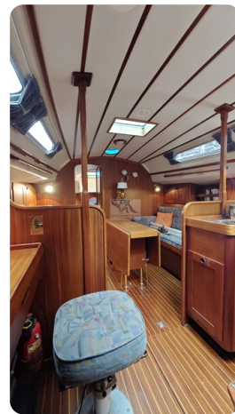
Sweden 340 SPITZMAUS 42