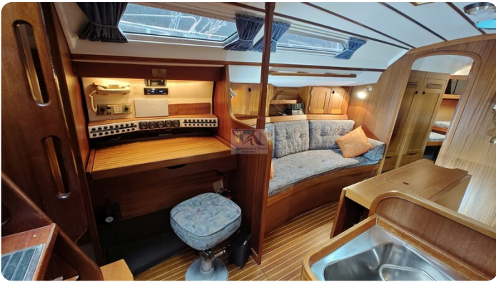
Sweden 340 SPITZMAUS 3