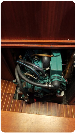
Sweden 340 SPITZMAUS 44