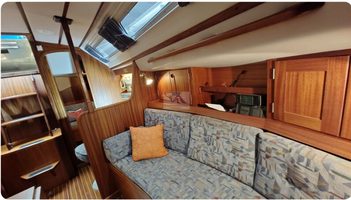
Sweden 340 SPITZMAUS 21