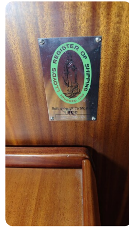
Sweden 340 SPITZMAUS 59