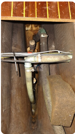
Sweden 340 SPITZMAUS 29