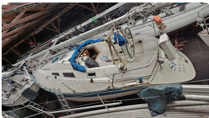
Sweden 340 SPITZMAUS 69