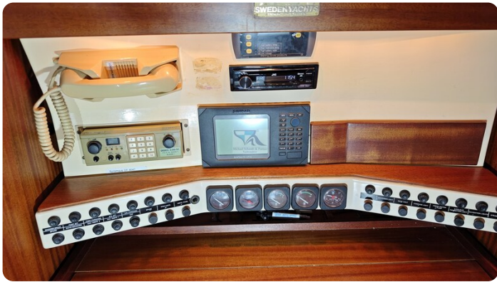
Sweden 340 SPITZMAUS 6