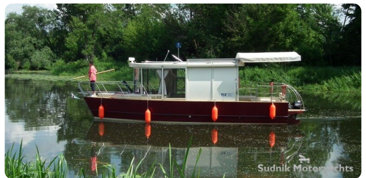
Hausboot SM 30 msp-398859 (22)