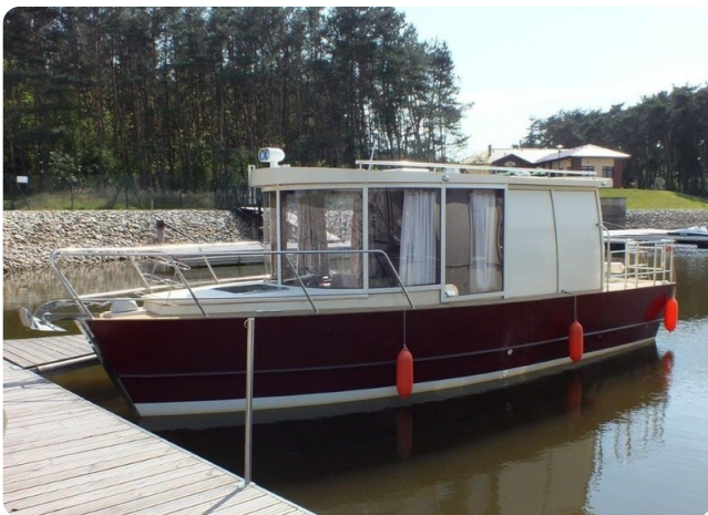
Hausboot SM 30 msp-398859 (23)