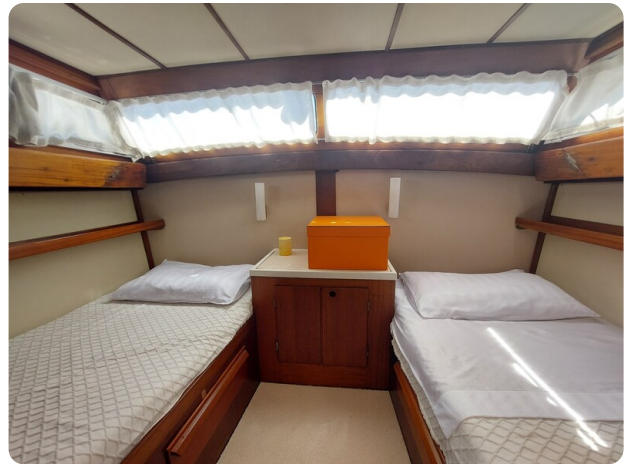
Storebro vip cabin1