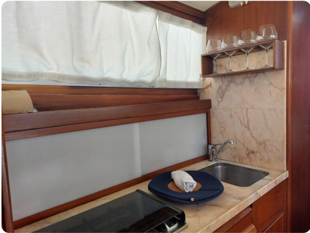
Storebro galley detail