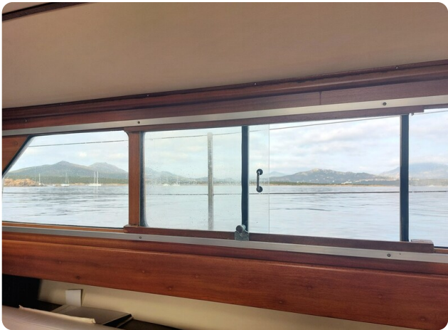
Storebro wide side windows