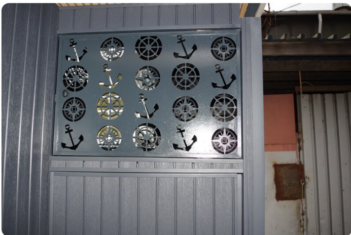
Shogun Hausboot 1000 23