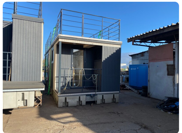
Shogun Hausboot 1000 14