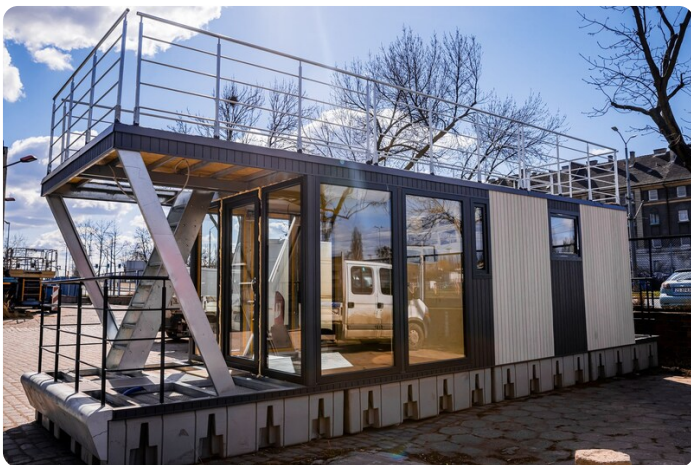
Hausboot DIY msp689353 8