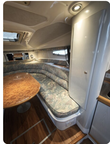
Sealine 28 BELLA 18