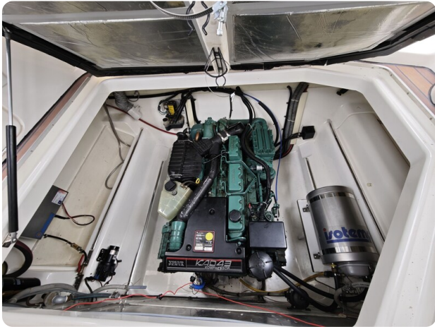
Sealine 28 BELLA 1