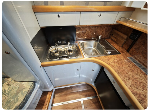
Sealine 28 BELLA 34