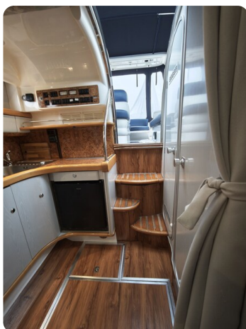
Sealine 28 BELLA 24