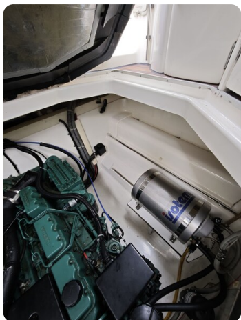
Sealine 28 BELLA 6