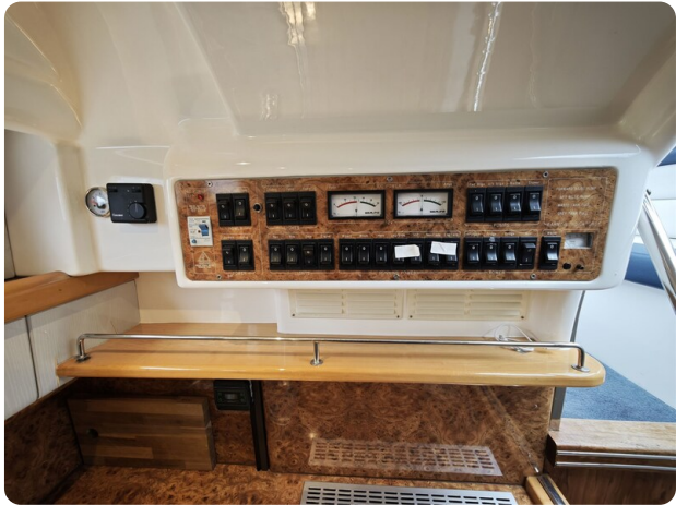
Sealine 28 BELLA 38