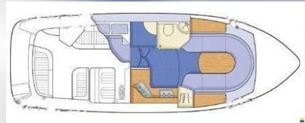
Layout Sealine 28 Sport