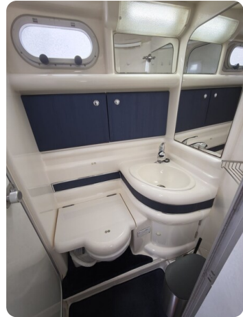
Sealine 28 BELLA 25