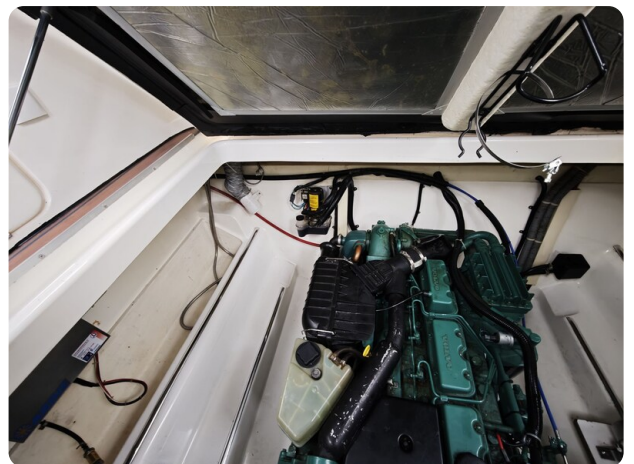
Sealine 28 BELLA 7