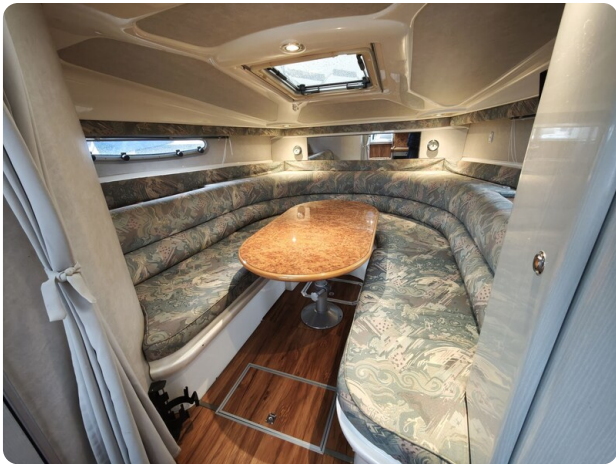
Sealine 28 BELLA 15