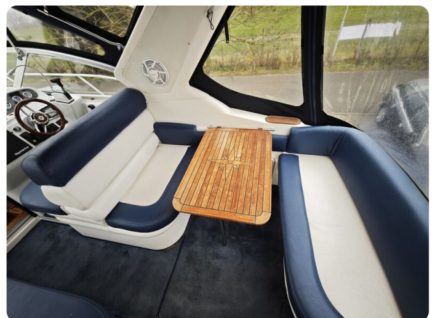
Sealine 28 BELLA 45