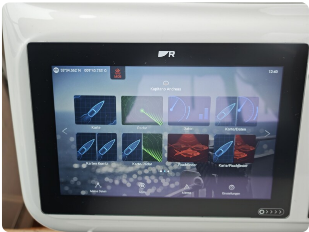
Sealine 28 BELLA 13