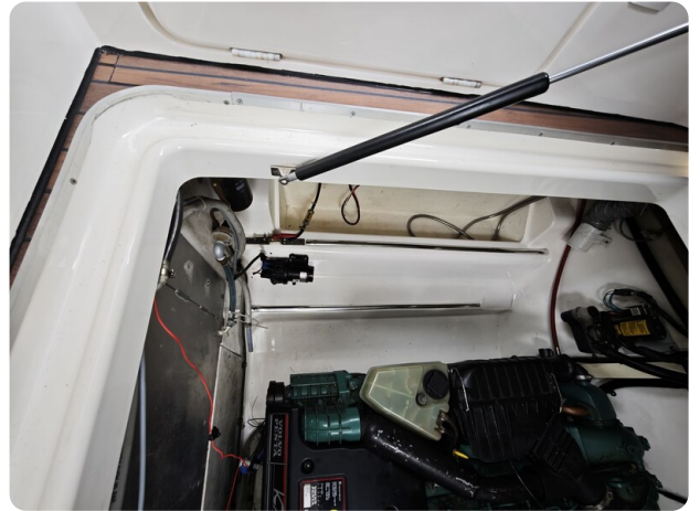
Sealine 28 BELLA 3