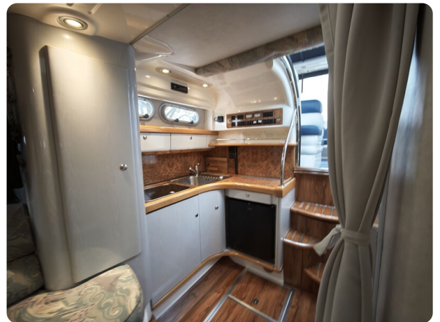
Sealine 28 BELLA 21