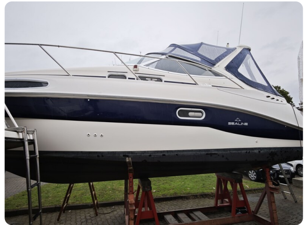
Sealine 28 BELLA 64