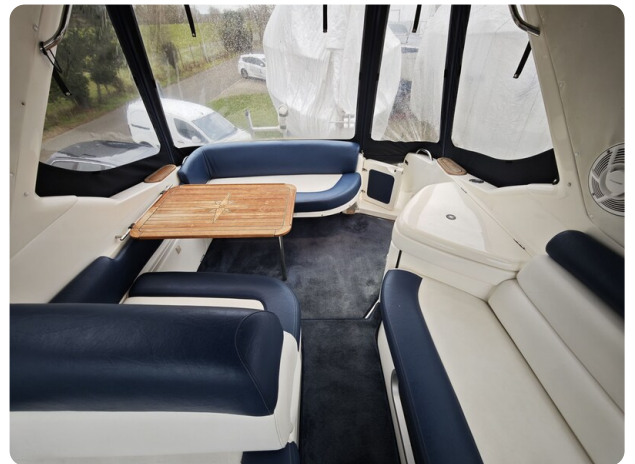
Sealine 28 BELLA 40