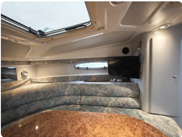
Sealine 28 BELLA 20