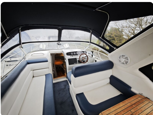
Sealine 28 BELLA 44