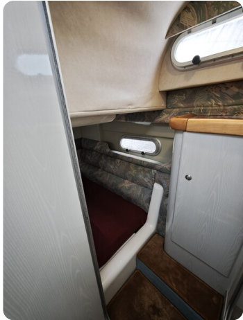
Sealine 28 BELLA 30