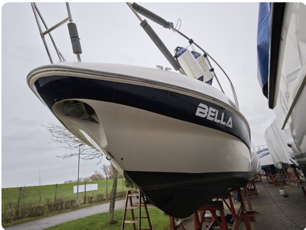
Sealine 28 BELLA 63