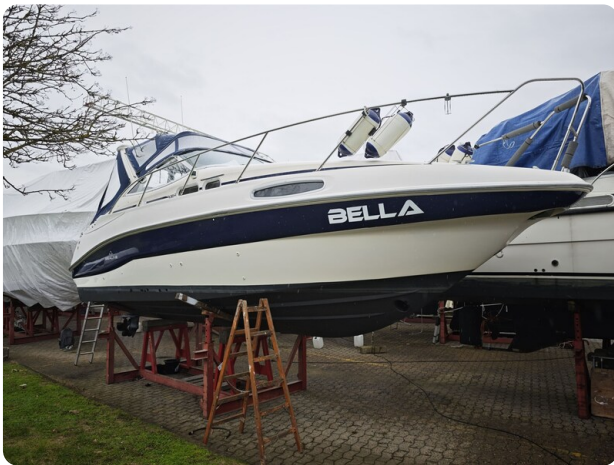
Sealine 28 BELLA 61