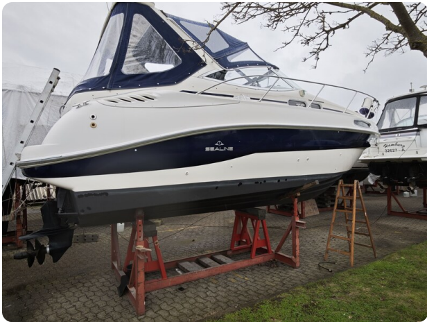
Sealine 28 BELLA 60