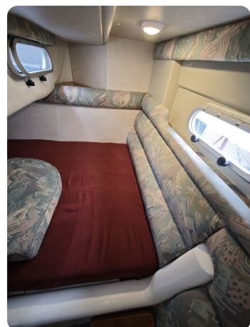
Sealine 28 BELLA 33