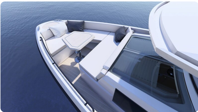
Saxdor 340 WA bow dinette