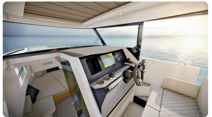
Saxdor 340 WA helm