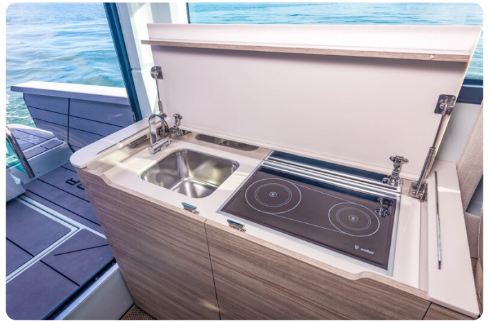
Saxdor 320 GTC galley