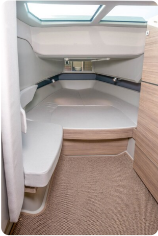
Saxdor 320 GTC cabin view