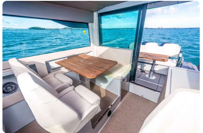
Saxdor 320 GTC salon to aft