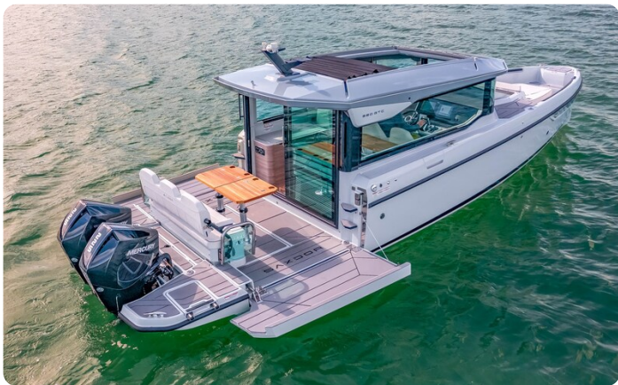
Saxdor 320 GTC details