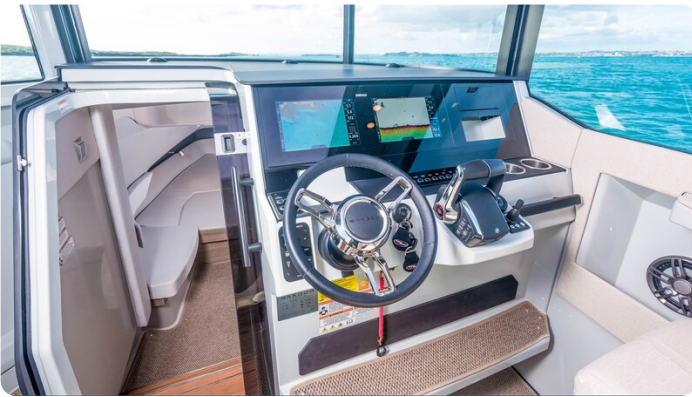
Saxdor 320 GTC helm