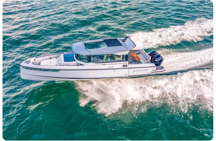
Saxdor 320 GTC aerial 2