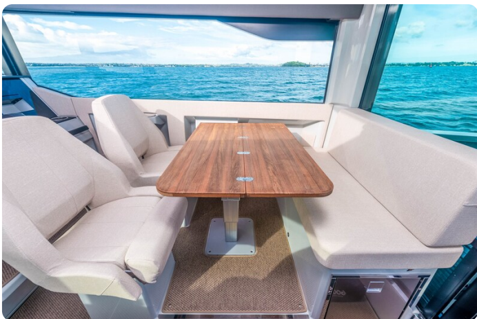
Saxdor 320 GTC dinette detail