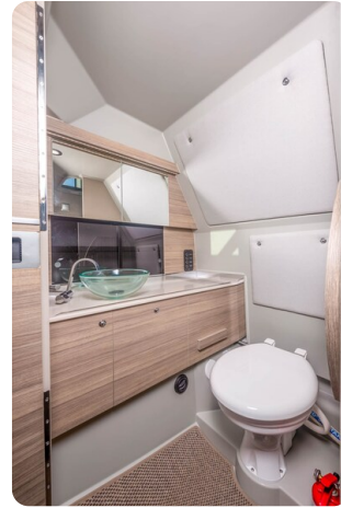
Saxdor 320 GTC head