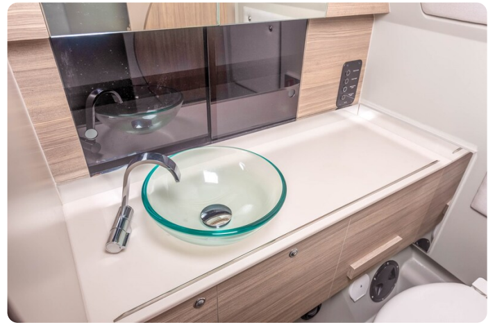
Saxdor 320 GTC bathroom