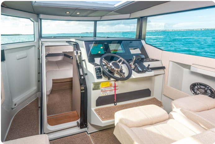
Saxdor 320 GTC helm station