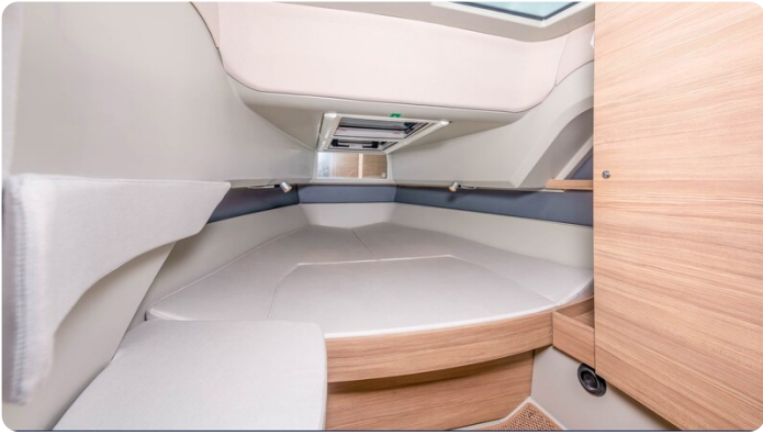
Saxdor 320 GTC cabin