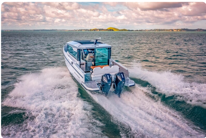
Saxdor 320 GTC aft view