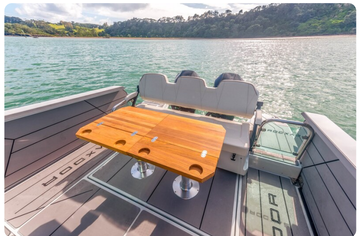
Saxdor 320 GTC cockpit dinette