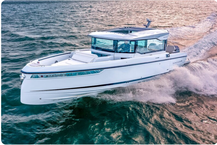
Saxdor 320 GTC running