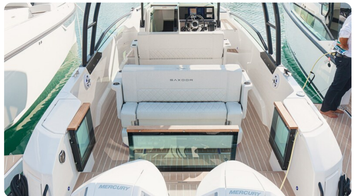
SAXDOR 270 GTO Stern