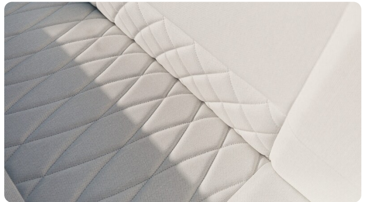
SAXDOR 270 GTO Sofa detail