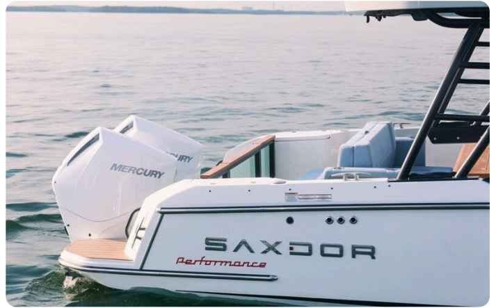
SAXDOR 270 GTO Stern view