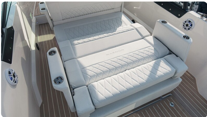
SAXDOR 270 GTO Convertible dinette