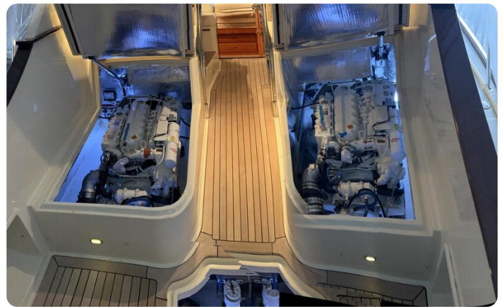
{1} Engine room