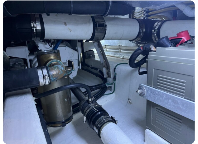
{I} Engine room