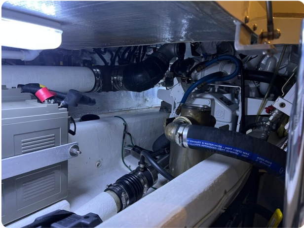
{I} Engine room