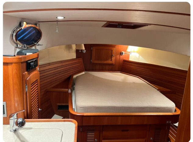
San Juan 4, berth0