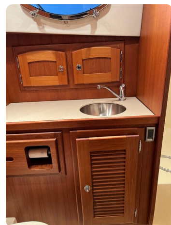
San Juan 40 bathroom