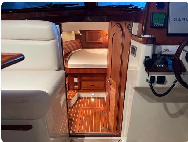
San Juan 40, lower deck access