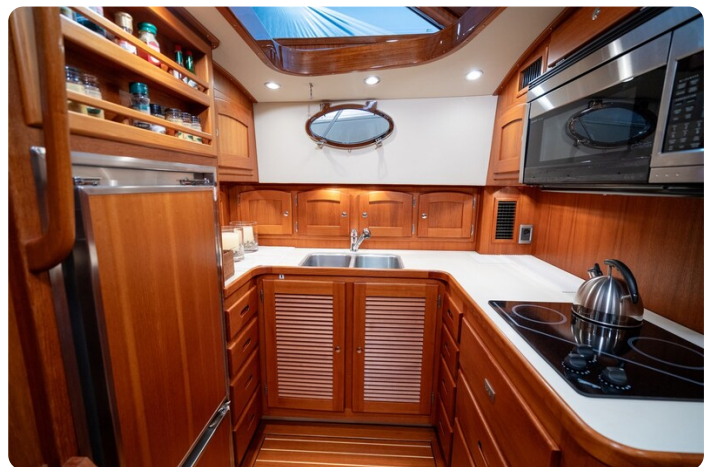
San Juan 48 galley