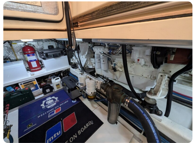
San Juan 48 engine room detail