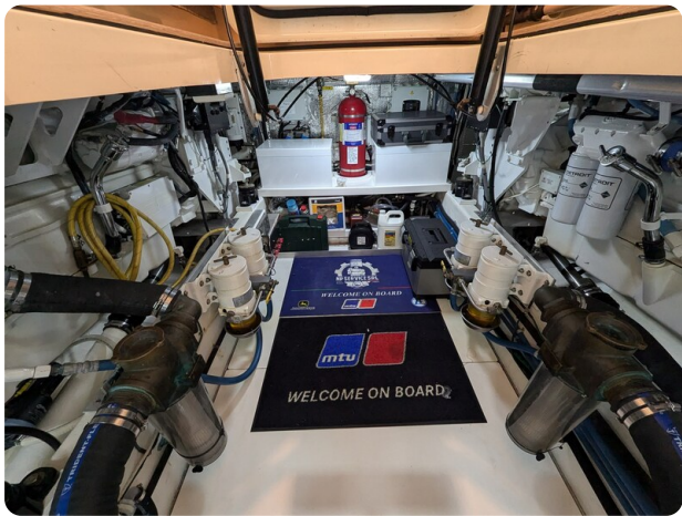
San Juan 48 engine room