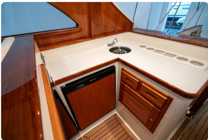
San Juan 48 upper bar