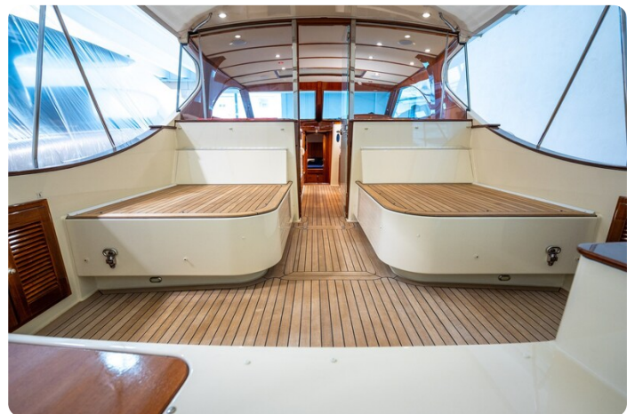
San Juan 48 cockpit