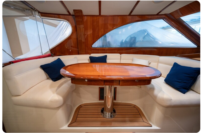
San Juan 48 dinette