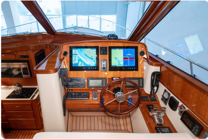
San Juan 48 Helm detail