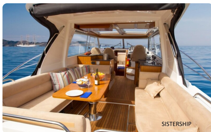
Saga 390 HT Sistership 2.jpg