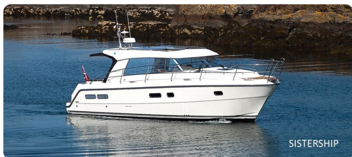
Saga 39 HT sistership