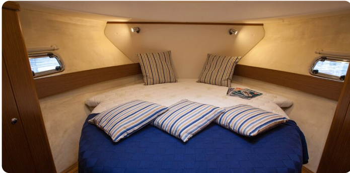
Saga 390 HT