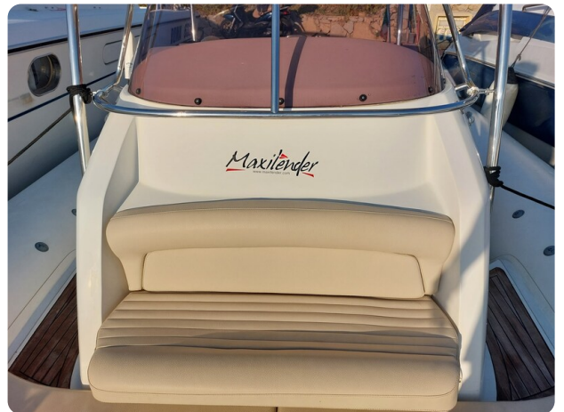
sacs stratos 12 pics 184803