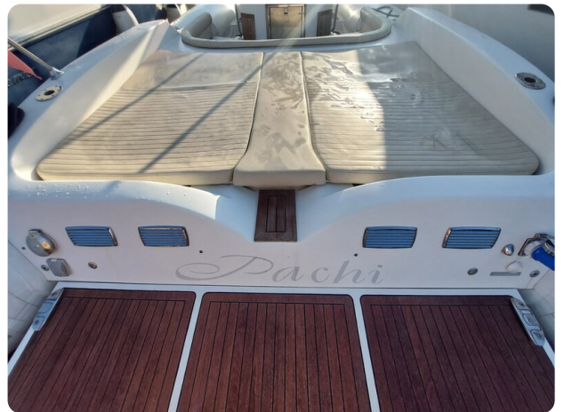
sacs stratos 12 pics 184435