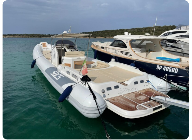
Sacs stratos 12 vista laterale1