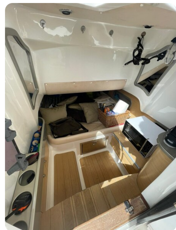
Sacs Stratos 12 interior