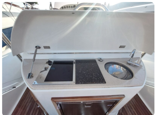
sacs stratos 12 pics 184554