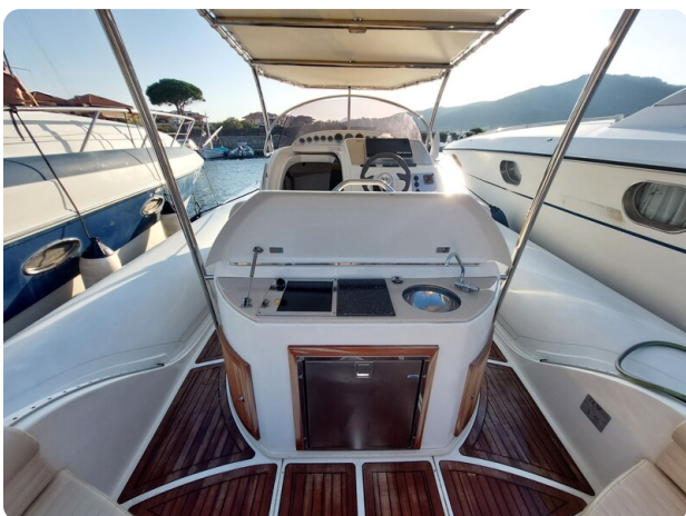
sacs stratos 12 pics 184549