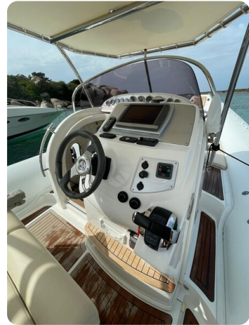
Sacs Stratos 12 prua console