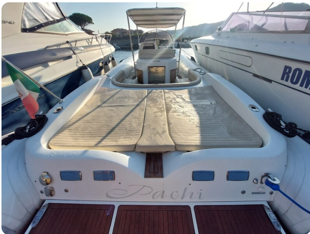
sacs stratos 12 pics 184429