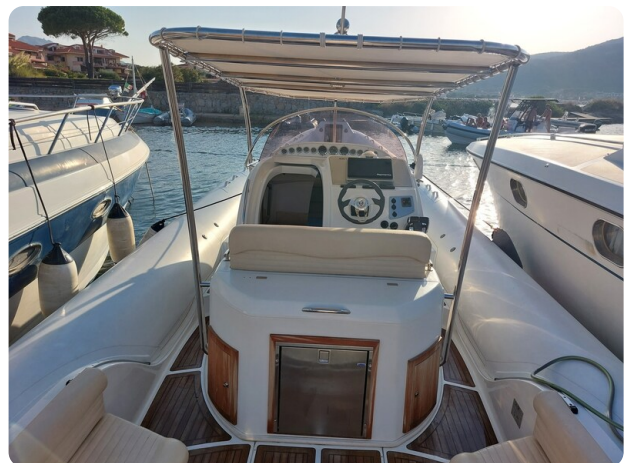
sacs stratos 12 pics 184401