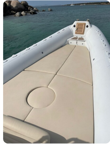
Sacs Stratos 12 prua