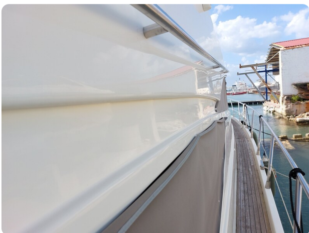
Rodman Yacht 64 Belisa, passaggio laterale