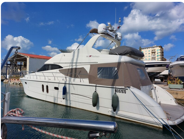
Rodman Yacht 64 Belisa, profile 1