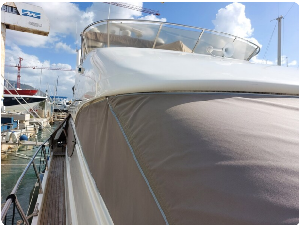
Rodman Yacht 64 Belisa, telo copri finestra dettaglio