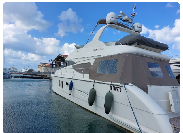
Rodman Yacht 64 Belisa, profile2