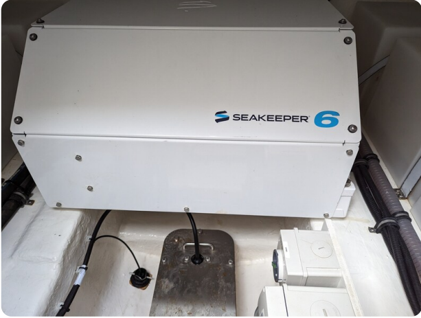
Riviera 45 Fly Seakeeper