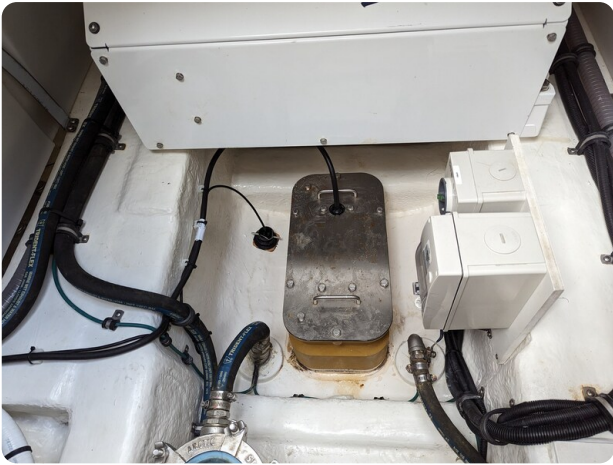
Riviera 45 Fly echo transducer