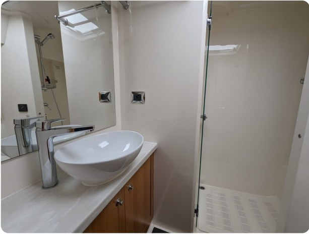
Riviera 45 Fly owner's bathroom